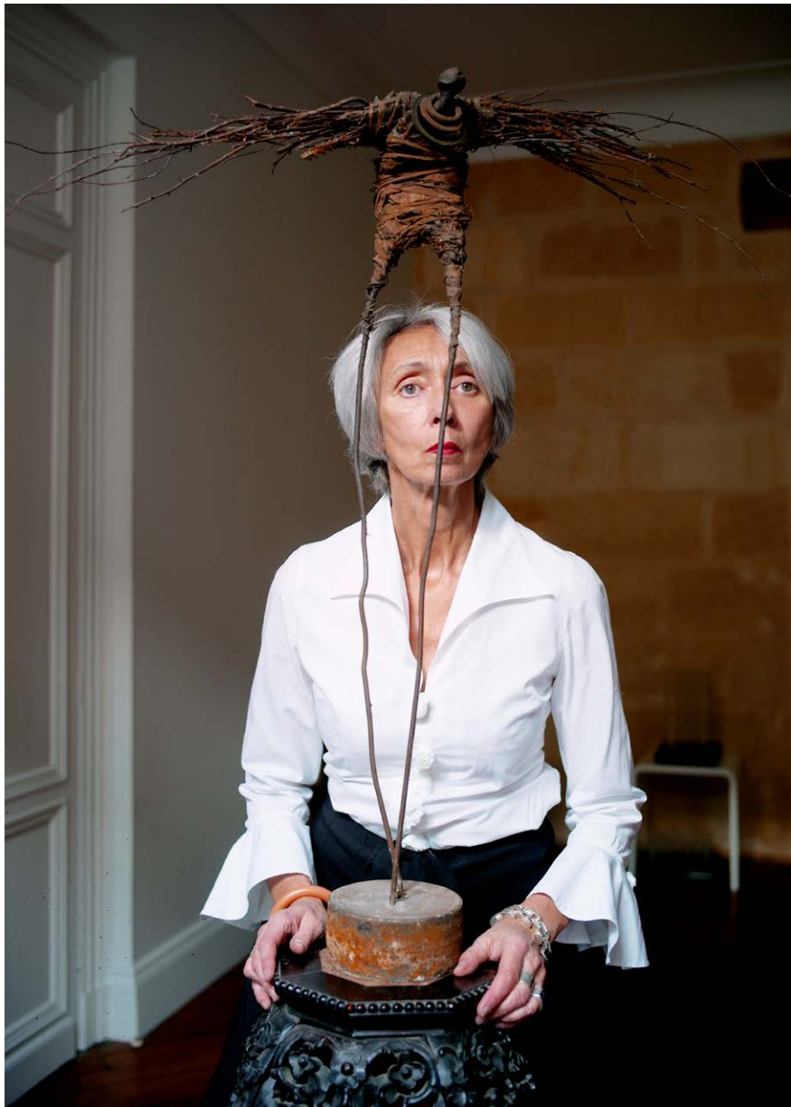
Ci-dessus. Sculpture métal, textile, terre et végétal de Marc Perez sur un socle en bois de fer chiné.