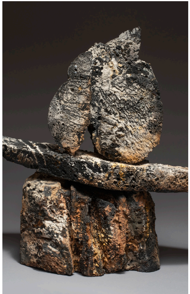
Marc Perez L'écueil - 2022 Technique mixte - H : 55cm