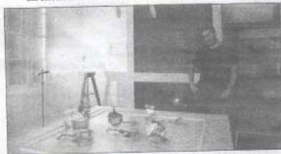
Le monde de Jérôme Gelès