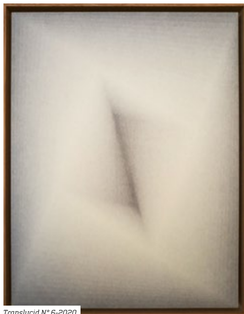
Translucid N° 6-2020

jusqu'au samedi 29 octobre, Galerie La Mauvaise Réputation, Bordeaux (33). www.lamauvaisereputation.net