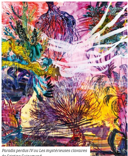
Paradis perdus IV ou Les mystérieuses clavaires de Cristine Guinamand